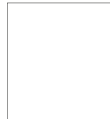
Schulleiter/-in (Stelle wird besetzt)