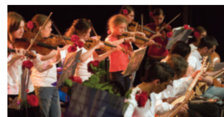
Schöne Töne: Riehens Jugend musiziert. (a)

Wer Erholung in der Natur sucht oder Lust auf eine Erkundungstour im historischen Ortskern hat, ist in Riehen ebenso am richtigen Ort, wie anspruchsvolle Kunst- oder Architekturliebhaber. Die Gemeinde ist in der Vergangenheit verwurzelt und zugleich für die Zukunft bestens gerüstet: Sie betreibt die grösste Geothermieanlage der Schweiz und setzt sich für ökologische Nachhaltigkeit ein. 2004 wurde Riehen für seine Energiepolitik als erste Gemeinde mit dem «European Energy Award in Gold» ausgezeichnet. Riehen engagiert sich auch in der Familien- und Jugendpolitik und ist seit 2011 stolze Trägerin des Unicef-Labels «Kinderfreundliche Gemeinde». Damit Riehen auch in Zukunft ein liebens- und lebenswerter Ort bleibt.