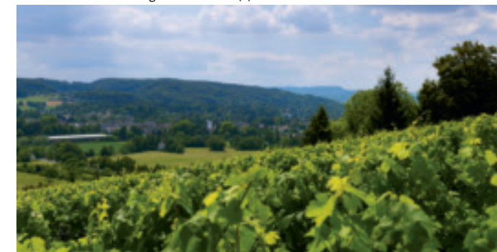
So weit das Auge reicht: Blick von der Tüllinger Höhe.