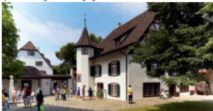
Spielerisch erkunden: das Spielzeugmuseum Riehen.