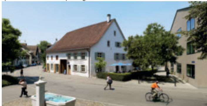
Alt und neu: Schweizerhaus und Singeisenhof.