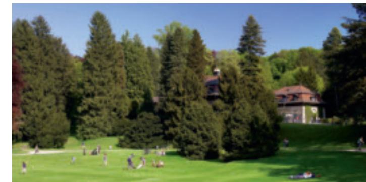
Treffpunkt für Gross und Klein: Wenkenpark Riehen.