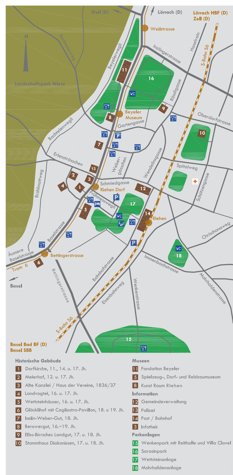
Planausschnitt erweitertes Dorfzentrum.