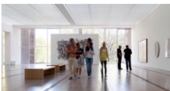
Kunst mit Weltformat: die Fondation Beyeler.